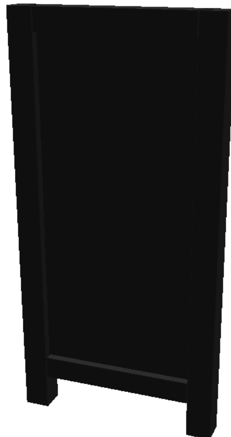
Version à boulonner dans des fourreaux